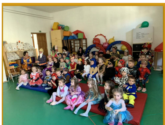
ÓVODAI FARSANG 2023