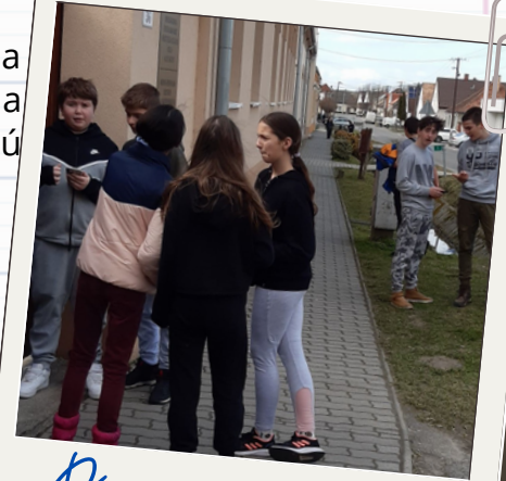
Pénz7 - 2023.

Az Oktatási Hivatal minden évben megszervezi a PÉNZ7 rendezvénysorozatát, melynek célja a pénzügyi és vállalkozói kultúra játékos, élményalapú fejlesztése. A témahét tanórán kívüli programjai is ezt támogatják. Iskolánk diákjai idén részt vettek a Pénzfutam - A 2023. évi PÉNZ7 Pénzügyi és vállalkozói témahét kísérőeseményén a Pénziránytű Alapítvány és a Medve Matek támogatásával, amely során online játékos feladatokat oldottak meg mobil telefon használatával. A feladat érdekessége volt, hogy Google térkép segítségével kellett a csoportoknak megkeresniük a helyszíneket a falu központjában, itt a „felhőből” kapták meg a pénzügyi kérdéseket. A futam végén virtuális okleveleket kaptak a csapatok.